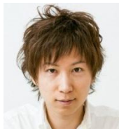
Your new friend Satoshi